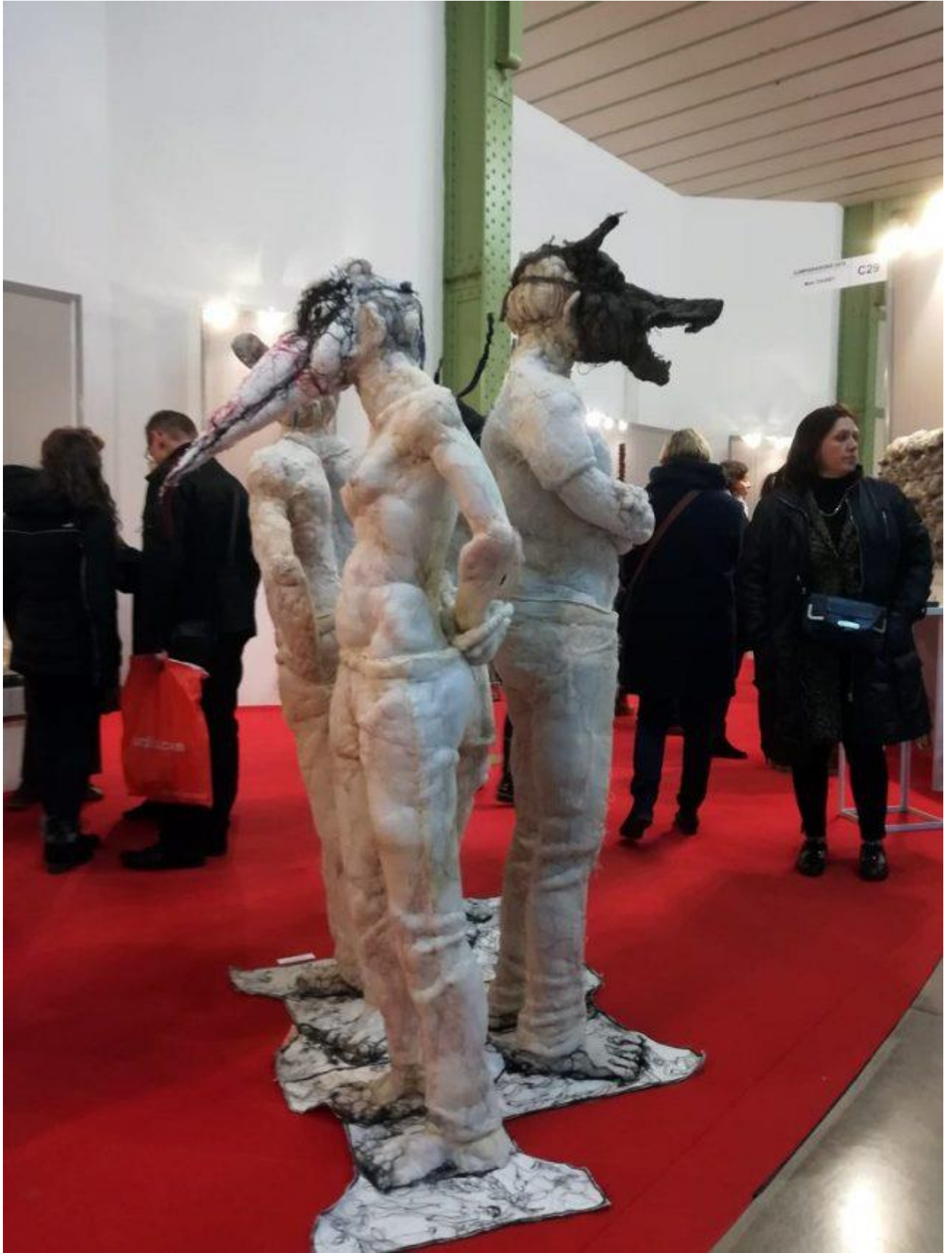
Voici un petit focus sur les deux précurseurs.